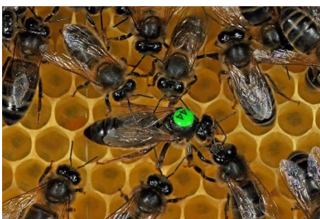
Regina su nuovi telaini