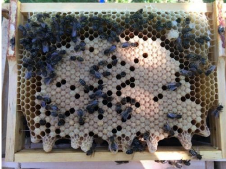
Celle di sciamatura su un telaino di miniplus