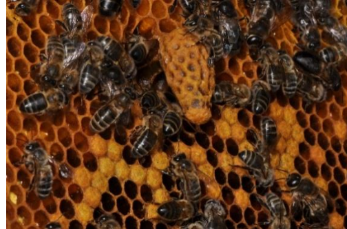
Cella di sostituzione